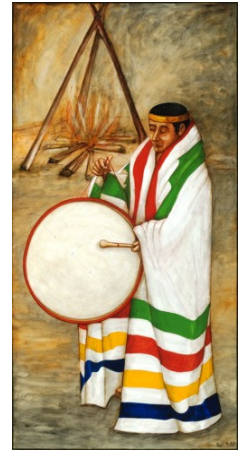
Exposition J'aurai ta peau Œuvre de André Michel ©La maison amérindienne

La Maison amérindienne présente J'aurai ta peau du peintre ethnographe André Michel. Cette exposition rappelle l'importance et les répercussions sur le mode de vie des Premières Nations de la couverture à points de la Compagnie de la baie d'Hudson, devenue un emblème canadien associé aux légendes de nos explorateurs et au développement de la nation. Par ses immenses tableaux et les textes qui les accompagnent, André Michel veut souligner que la Compagnie de la baie d'Hudson était bien plus désireuse d'enregistrer des profits que d'écrire l'histoire.