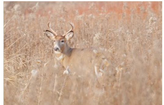
Un chevreuil capté sur le vif!

Le Biophare présente jusqu'au 7 septembre 2009 Quand la lumière peint , une belle escapade dans la nature à travers l'œil des photographes Francine Ouellet et Mario Cloutier. Aussi, pour la septième année consécutive, le musée poursuit la réalisation d'une importante activité culturelle et éducative auprès des élèves de la Commission scolaire de Sorel-Tracy. Cet été, plus de 1200 jeunes de 5 e et 6 e années exposent, au parc Regard-sur-le-Fleuve, des peintures représentant des plantes sorties tout droit de leur imaginaire, dans le cadre de l'exposition extérieure bien spéciale intitulée Coup de pousse .