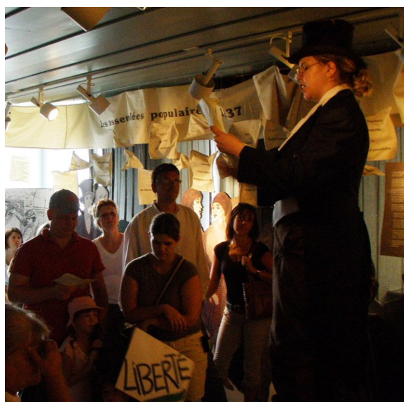
Visite théâtrale, fête du Vieux-Marché

Maison nationale des Patriotes , 610 chemin des Patriotes, Saint-Denis-sur-Richelieu Renseignements et réservation : 450 787-3623 et le www.mndpqc.ca .